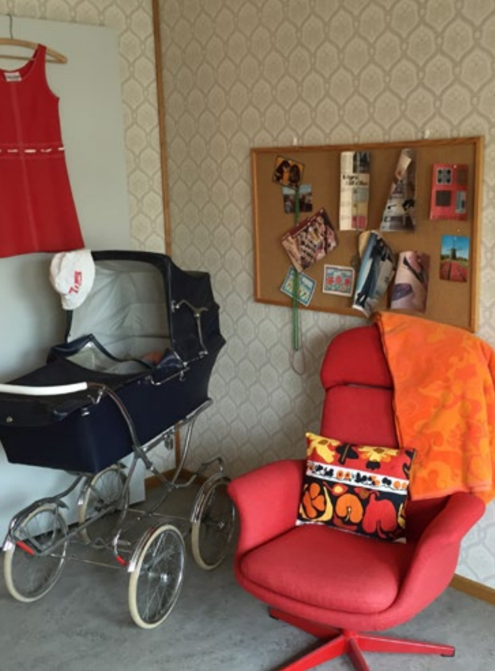
Vätterhems museilägenhet från 70-talet, Havsörngatan 105.