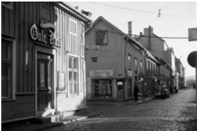
FOTONDETTA UPPSLAG WEINERKARLESTEDT